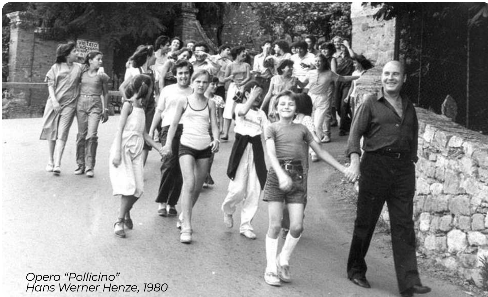
Opera "Pollicino" Hans Werner Henze, 1980

Montepulciano è un'officina per giovani artisti Hans Werner Henze